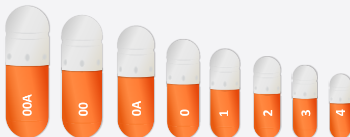
Tabela de variação de comprimento para corpo e tampa da cápsula Tomizo de acordo com o tamanho da cápsula: